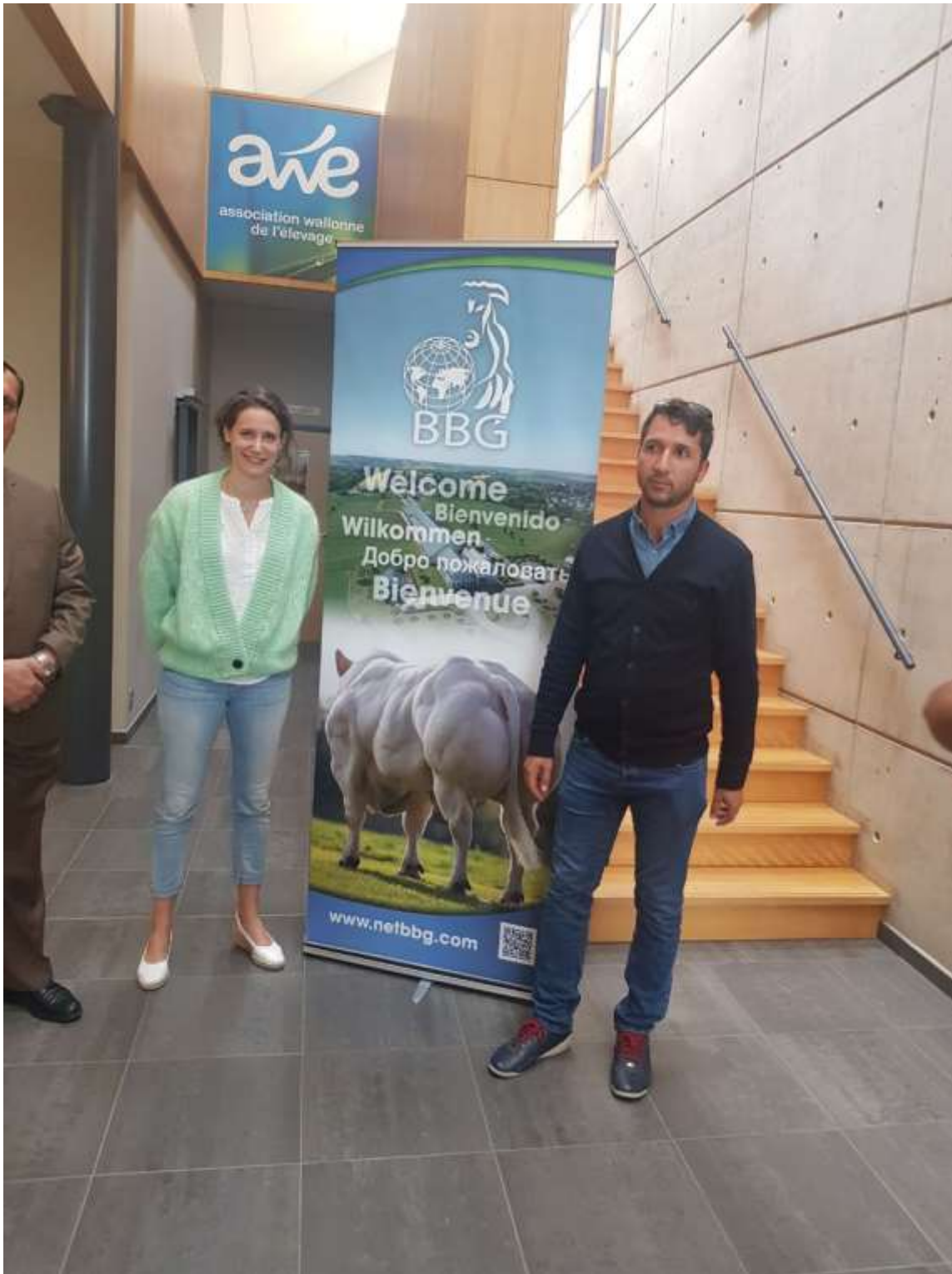
بازدید از شرکت BBG